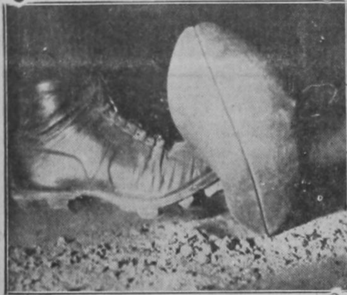
Temiendo que la publicación de esta gráfica la pasada—sea interpretada como alusión internacional y no teniendo deseos de canocer Tegucigalpa, que es muy fea, nos abstenemos de ponerle lectura al pie.