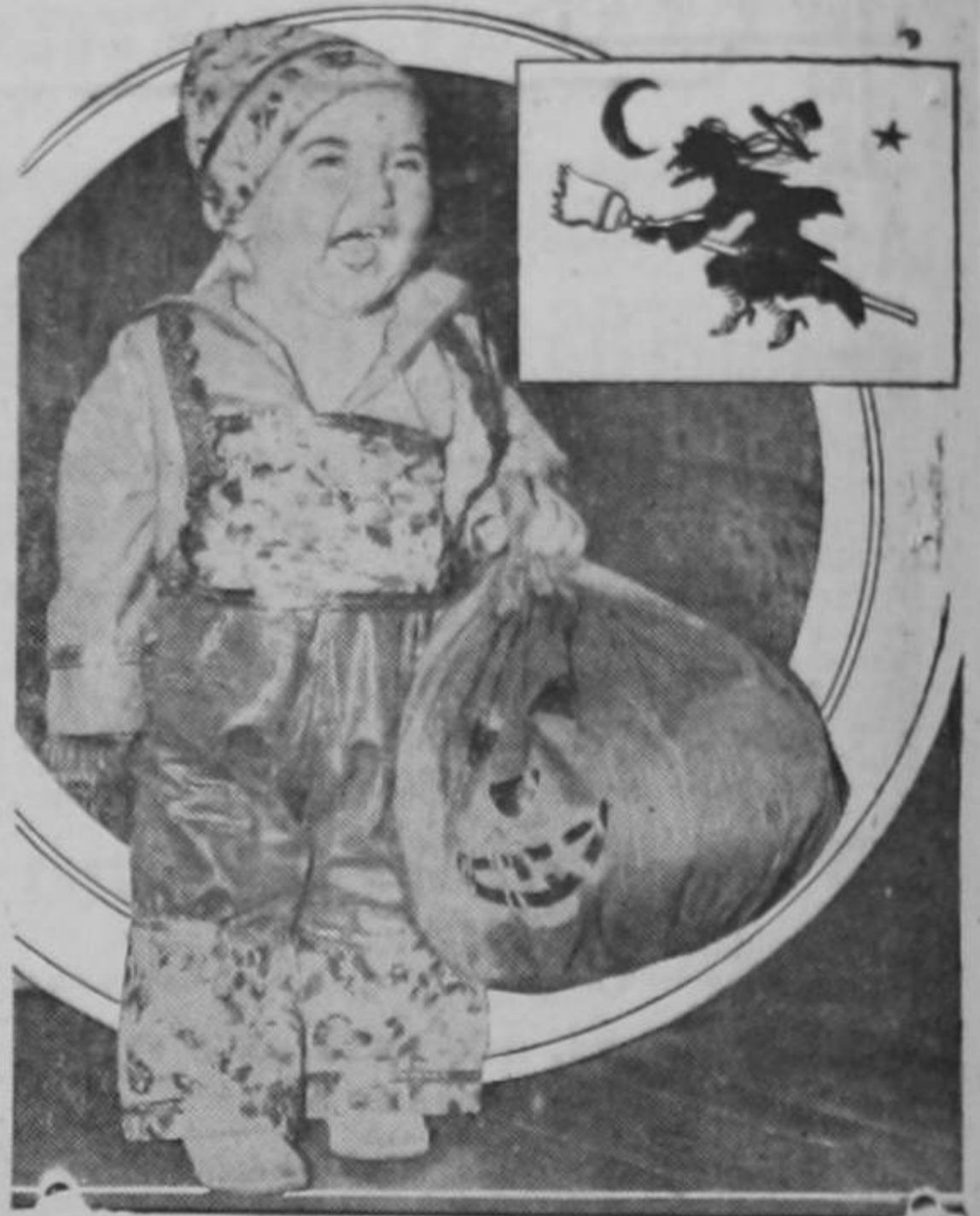
Los chiquillos de las escuelas de San José no creen en brujas. Ni en brujas ni en «generales».